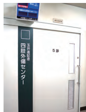
四肢外傷センター外来

「奈良医大キャンパスだより」の内容に関する問い合わせやご意見等ございましたら、右記までご連絡ください。