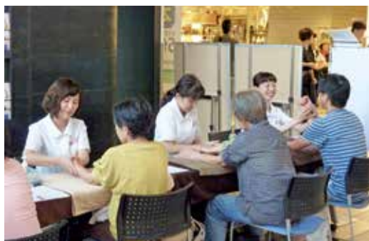
アロママッサージの様子

今後ともこのような活動を通じて地域の方々とともに健康長寿のための活動を展開していきたいと考えています。