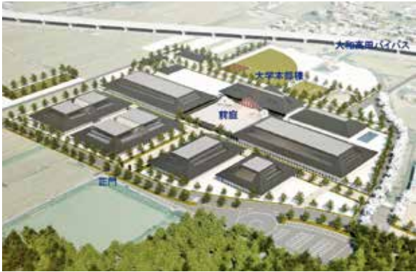
新キャンパスの整備イメージ

容・規模など具体的な諸元の検討を進めており、それらが決まり次第、建築に向けた設計を行うこととしています。