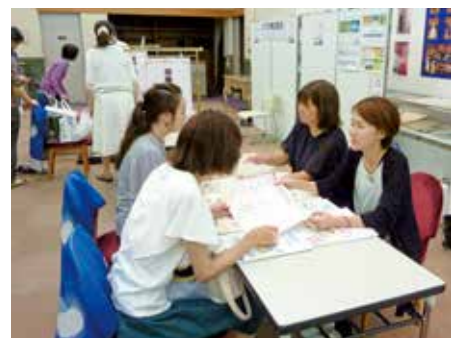
栄養と健康について紹介している様子