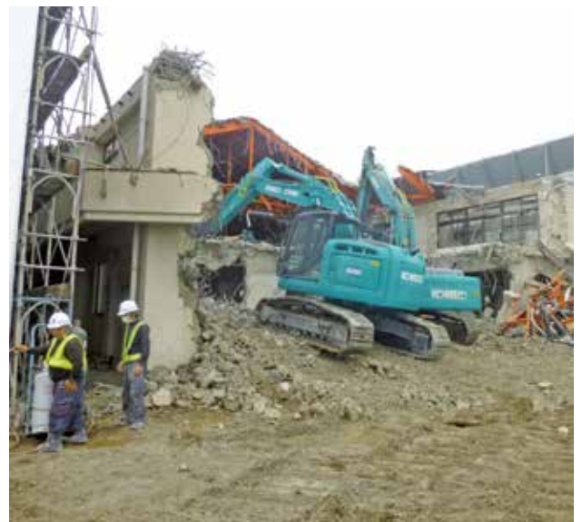
旧農業研究開発センター除却＜ H29 ＞

以上のとおり、多くの工程が控えておりますが、本学の将来像実現の場となる新キャンパスの完成に向け、教職員一丸となつて取り組んで参りますので、皆様の一層のご理解・ご協力を賜りますようお願い申し上げます。