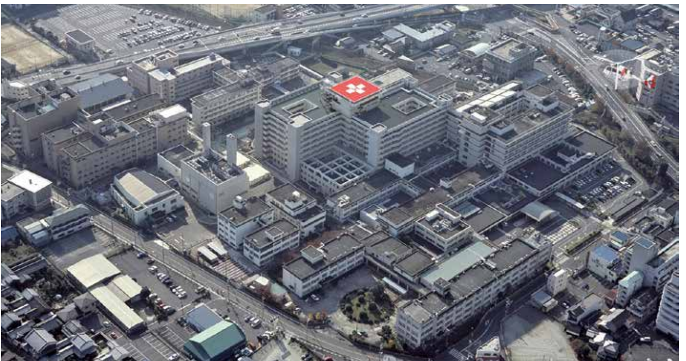
ヘリポートの完成イメージ