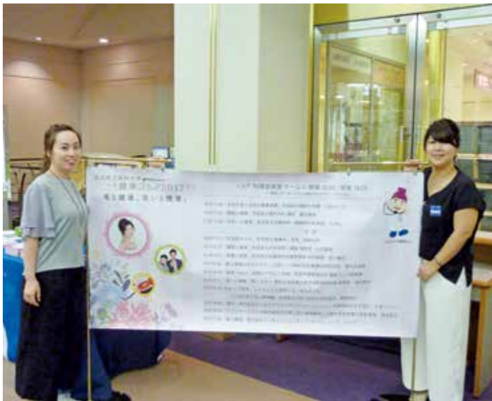
紹介するスタッフ

一方、企業ブースとして、江崎グリコ株式会社 健康科学研究所ブースでは、同社の研究から生まれた商品や研究成果の紹介、ニ