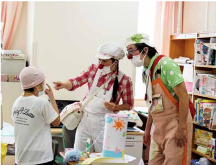
小児センターの様子

例えば、重症心身障害をもつ子どもたちの家族が自宅への退院を希望した場合、人工呼吸器