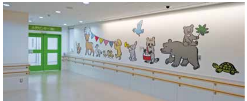
小児センターの通路に描かれたホスピタルアート

最後に、新病棟の壁紙には、ホスピタルアート（病院の雰囲気や温かなものにし、患者の心を癒す効果が期待できる）を導入しました。これは医療スタッフ全員で、子どもたちへの思いを寄せて描いたものです。そんな子どもたちのことが大好きなスタッフが、毎日笑顔