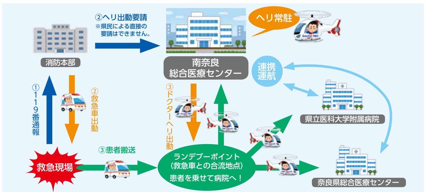
『要請』から『出動』までの流れ