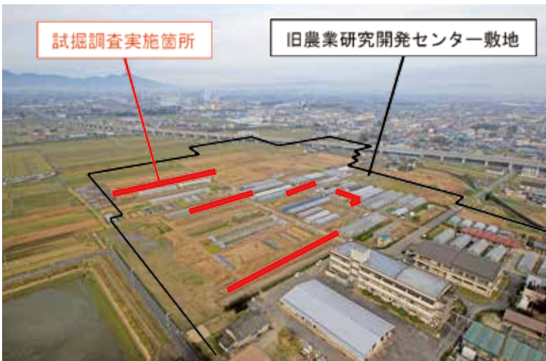
埋蔵文化財発掘調査（試掘）＜ H26～H28 ＞

新キャンパス敷地は、都市計画法の区域区分（市街化調整区域）をはじめ様々な土地利用上の規制を受けているため、行政庁への必要な許認可手続を進めて参ります。