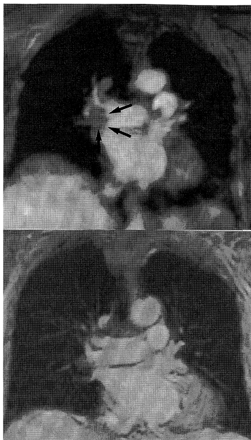
Fig. 1. Magnetic resonance angiography.

現病歴：平成9年1月初旬から腰痛のために近医に通院中であった。1月中旬からは腰痛が増悪したので，臥床状態にあった。2月3日に突然，胸痛および呼吸困難を自覚したので，近医に搬送された。入院時に施行されたMRAでは，右肺動脈主幹部に直径2cmの血栓像が認められた(Fig. 1の上半分)。また，同日に施行された