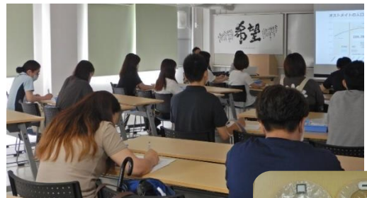
ストーマの基本を学ぶ

ストーマケアが求められる場面は救急看護の場面でも増えています。ストーマケアの知識と技術の向上を期待します。