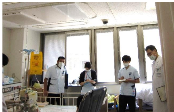
認知症ケアチームの病棟ラウンドを体験

附属病院では、様々な分野の認定看護師が実践しています。現場で働くスタッフの中には、認定看護師をめざそうと考えている方もいるでしょう。でもまだ決心ができないというスタッフに向けて、まずは認定看護師の実践を近くで共に活動しながら感じていく試みとして、本研修を企画しました。第1回では摂食嚥下障害看護分野と認知症看護分野に、第2回は皮膚・排泄ケアと集中ケア分野にそれぞれ1名の応募があり、各2日間の研修を行いました。実践者の視点で臨床現場を廻ることにより、改めて自分が看護師として現部署でどう働くかについて考える機会となったようです。