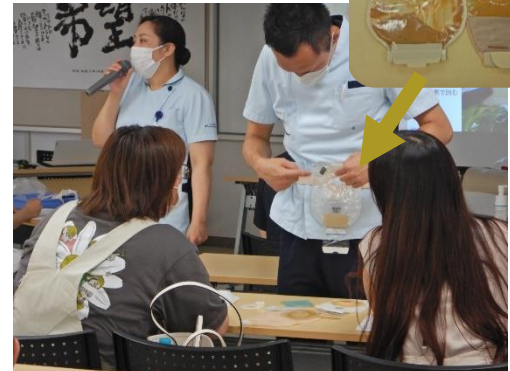
患者側の視点でストーマを見る