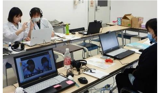
Teams を活用した薬理学演習

本学の「特定行為研修」も6年目となり、今年度は急性期コースに3名、慢性期・在宅コースに6名の受講生を迎えました。