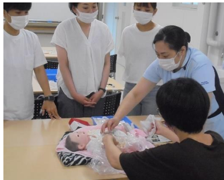
肌の弱い新生児につけるには…