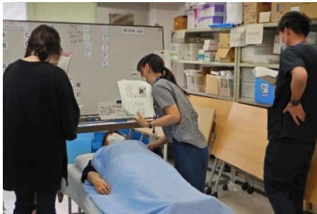
フィジカルアセスメント演習

4月に予定していた開講式は新型コロナウイルス拡大防止のため中止となりましたが、eラーニングの講義やリモートでの演習を行い、7月には対面講義を開始しました。演習では、模擬患者への問診や身体症状、フィジカルイグザミネーションにより、疾患を推察するなど実践的な内容で、受講生も真剣に取り組んでいました。9月に行われた実技試験（OSCE）にも無事合格し、10月からは臨地実習が始まりました。今後も関係機関と協力し、修了に向けて研修が滞りなく行われるようサポートしていきます。